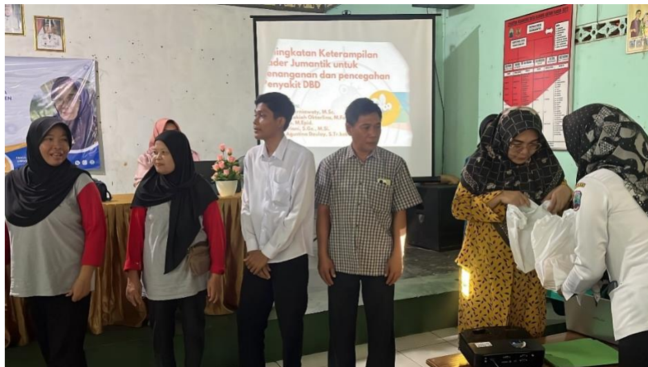
Gambar 3. Semangat Pengabdian Bersama Pamong Desa dan Pengelola Program P2 DBD Puskesmas Karang Anyar

Selain sesi pemaparan, acara juga dilengkapi dengan sesi tanya jawab interaktif, para peserta dapat berkonsultasi langsung dengan para ahli mengenai masalah kesehatan Demam Berdarah Dengue dan pilihan pencegahan. Antusiasme dan keaktifan peserta dalam sesi ini menunjukkan betapa besar minat dan kebutuhan mereka akan informasi yang disampaikan.