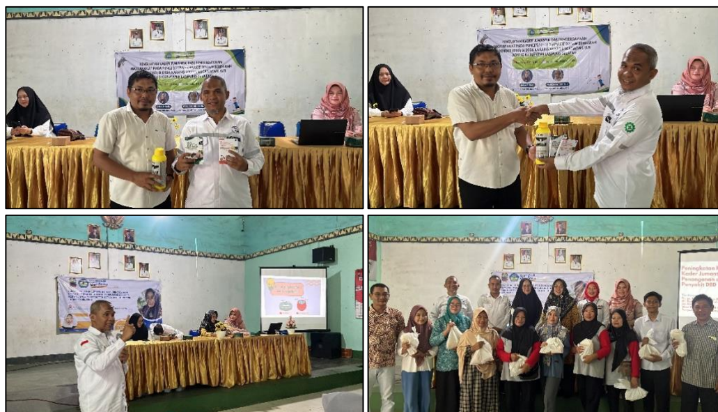
Gambar 4. Penyerahan Paket Abate, door prize dan Buku Saku pencegahan DBD dan Penjelasan Materi Pencegahan DBD

Pemberian doorprize dalam acara tersebut bisa menjadi cara yang baik untuk mendorong partisipasi dan kehadiran masyarakat. Selain sebagai bentuk apresiasi kepada peserta, pemberian doorprize juga dapat menjadi sarana untuk menyampaikan pesan-pesan penting tentang kesehatan Demam Berdarah Dengue kepada masyarakat.