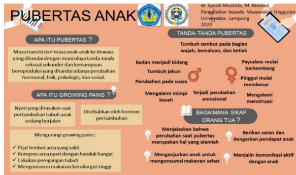
Gambar 1. Salah satu poster (alat peraga ) yang disebarluaskan dan digunakan dalam kegiatan

Hasil survei dengan menggunakan kuisioner yang kami sebar ke guru dan wali murid, memperlihatkan pengetahuan guru dan orang tua tentang pubertas sehat bagi anak anaknya masih dalam katagori cukup. Dari kuisioner diketahui bahwa mereka tidak memiliki waktu untuk menambah pengetahuan mereka mengenai pubertas dan motivasi mereka masih kurang.