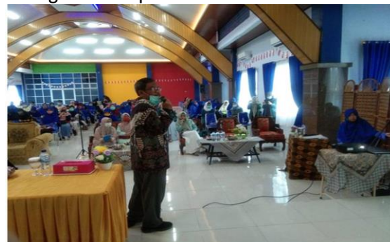
Gambar 3. Pelaksanaan Kegiatan Seminar dan Webinar. Peserta terdiri dari guru dan wali murid.

Kegiatan kedua adalah seminar yang mengintegrasikan peningkatan pengetahuan orang tua mengenai pubertas, pola dukungan orang tua terhadap anak usia pubertas, manajemen konflik keluarga dengan konsep hubungan orang tua-anak. Kegiatan ini dihadiri secara langsung oleh peserta maupun secara daring. Kegiatan ini dihadiri oleh 105 peserta secara langsung dan puluhan lainnya secara daring melalui aplikasi zoom.